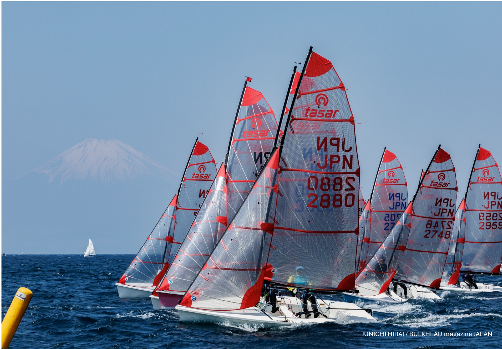
JUNICHI HIRAI / BULKHEAD magazine JAPAN