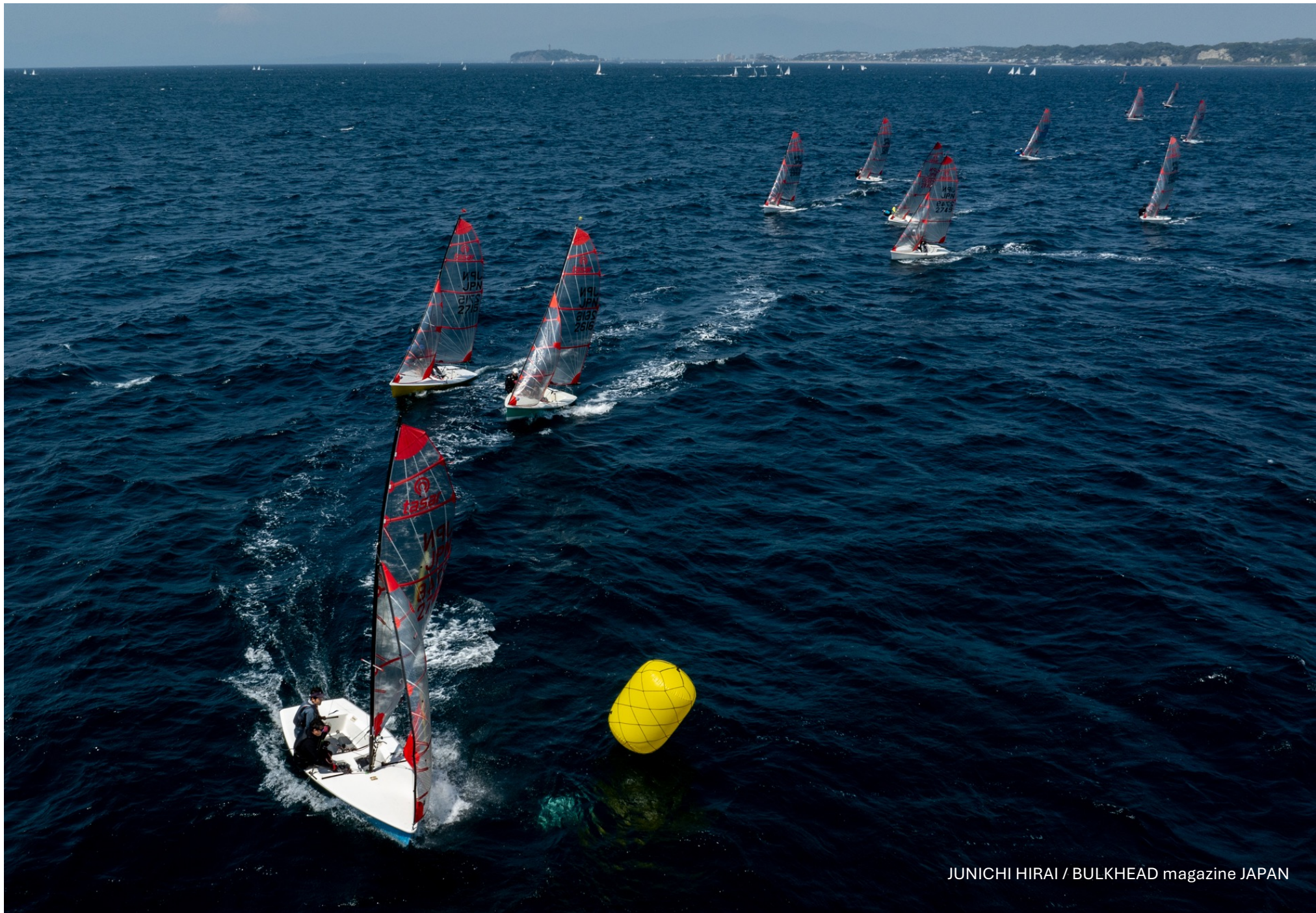
JUNICHI HIRAI / BULKHEAD magazine JAPAN